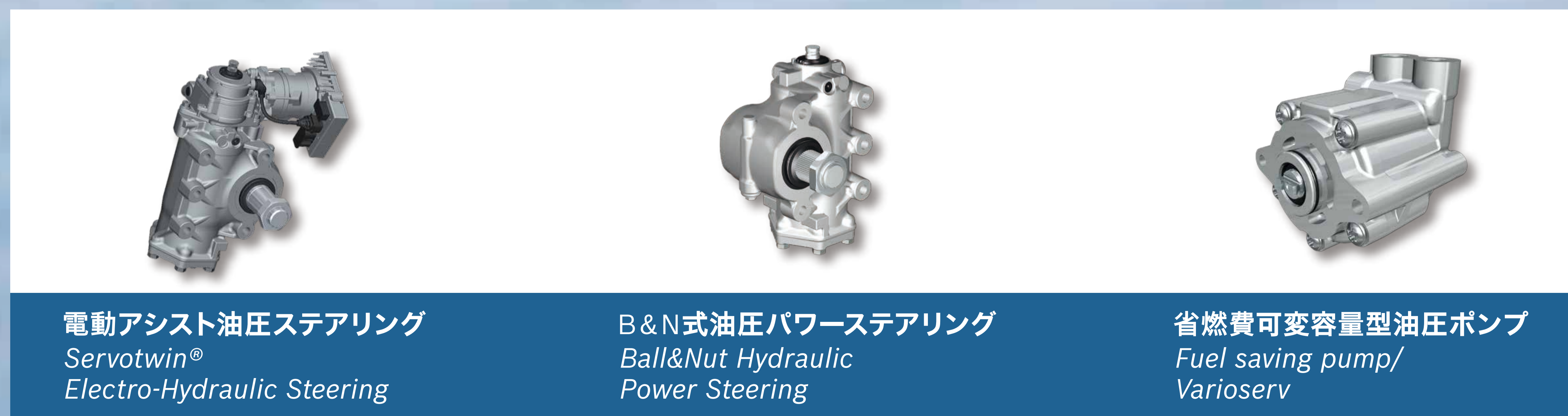
電動アシスト油圧ステアリング Servotwin® Electro-Hydraulic Steering