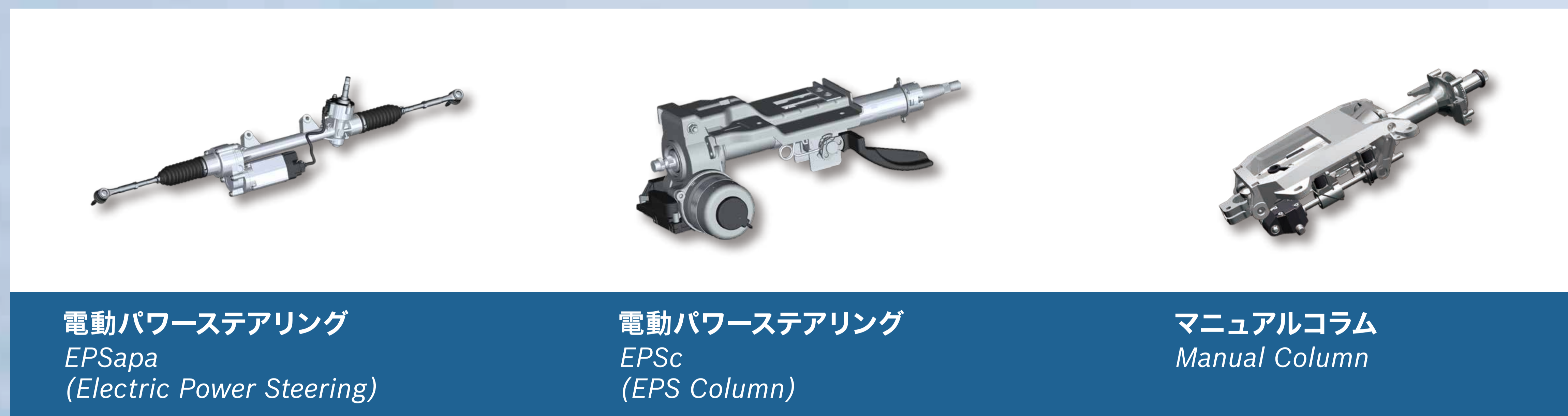
電動パワーステアリング EPSapa (Electric Power Steering)